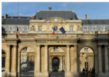
Le Palais Royal à Paris, siège du Conseil d'État.